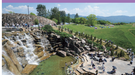
国営讃岐まんのう公園

新たに道路や堤防などの社会資本を整備するためには、土地(用地)が必要となります。土地の取得とそれに伴う損失の補償等を行うため、事業計画の説明、補償金の算定、権利者との交渉、登記、補償金の支払い等、一連の手続きを行います。