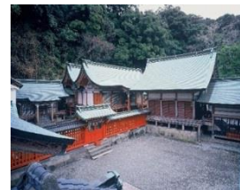
【大分市】柞原八幡宮