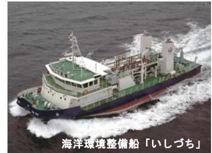
海洋環境整備船「いしづち」