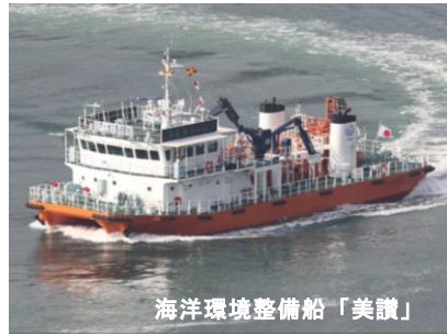
海洋環境整備船「美讃」