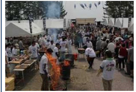
かつお祭り(5月第3日曜日)