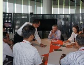
各地の地域によるメンテナンス活動の紹介