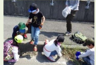
地域一体の取組みへのサポート