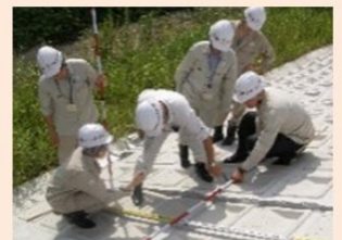
地域における技術者派遣の仕組みづくりの支援