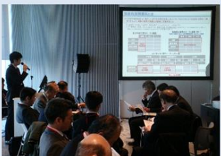
包括的民間委託等の民間活用取組み事例の紹介