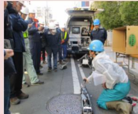
新技術導入の検討の現場試行の調整