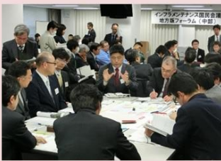
メンテナンスの課題を解決する技術等の紹介や技術マッチング