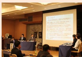
技術者の確保や育成に関する各地での取組み紹介