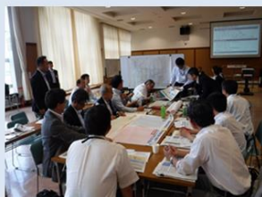
個別施設計画の策定・実施の課題解決につながるアイデア紹介