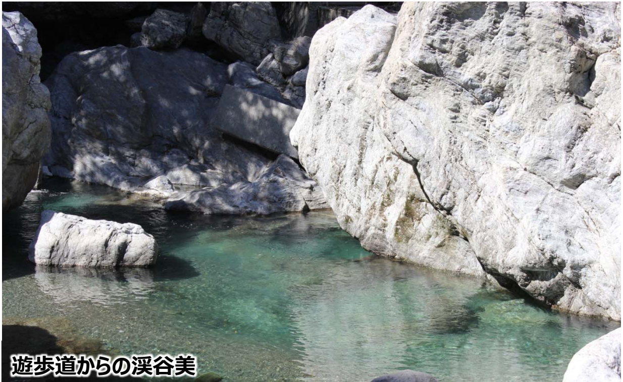
遊歩道からの溪谷美