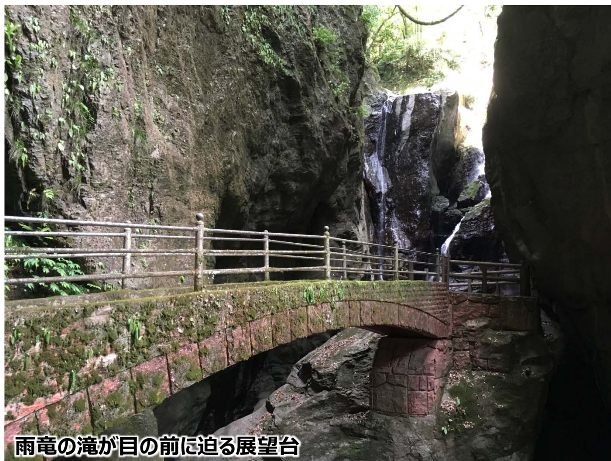
雨竜の滝が目の前に迫る展望台