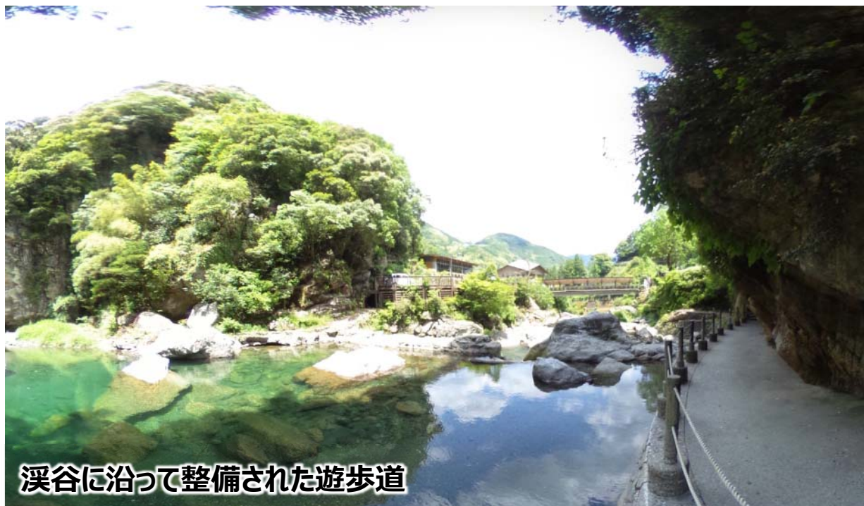
溪谷に沿って整備された遊歩道