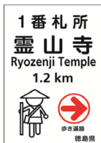
【決定したデザイン】