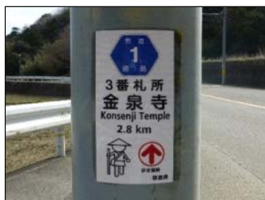
【県道での設置状況】