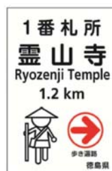
< 決定したデザイン >