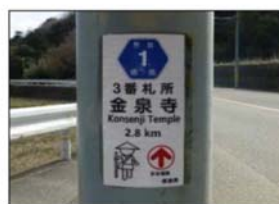
< 県道での設置状況 >