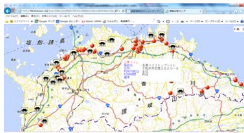
【遍路道トイレマップ】