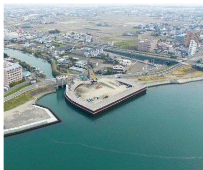
榎瀬川樋門改築【吉野川(応神箇所)】