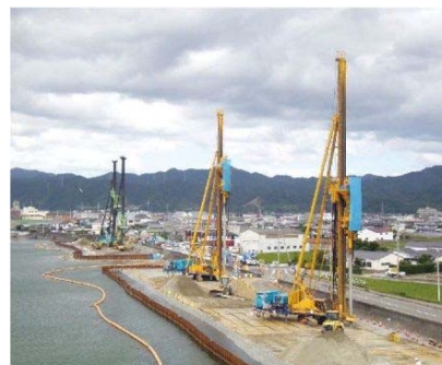
堤防液状化対策【旧吉野川(徳長地先)】