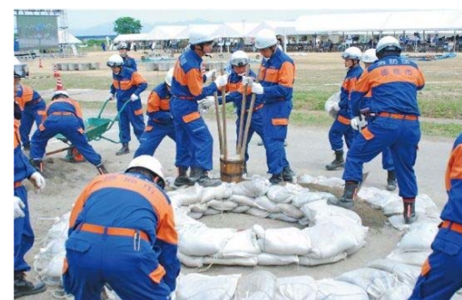
平成29年度 吉野川・那賀川合同総合水防演習

そのため、施設の運用や構造、整備手順などに、工夫をするとともに、今後想定される最大の洪水での、災害リスクの情報や危機感を地域社会と共有します。これらハード対策とソフト対策を一体的、計画的に推進することにより、想定される最大規模の洪水等が発生した場合でも、人命・資産・社会経済の被害をできる限り軽減します。