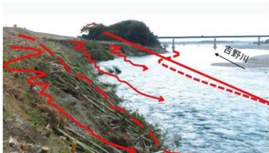
西原箇所(阿波市阿波町)における被災状況

砂州の固定化・拡大、樹林化、河床低下に伴い、洪水時には、堤防のり面・のり尻付近が削られる侵食被害が発生しています。特に平成26年8月の台風12号、11号は、中規模な洪水でしたが、堤防に向かう洪水流によって、西原箇所(阿波市阿波町)の侵食被害が発生しました。