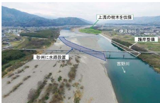
西原箇所における侵食対策のイメージ

そのため、砂州の発達や樹林化によって、侵食のリスクが高い区間では、樹木伐採や河道掘削等の河道管理と一体となった対策の実施により、堤防の決壊など重大な災害の発生を未然に防ぎます。