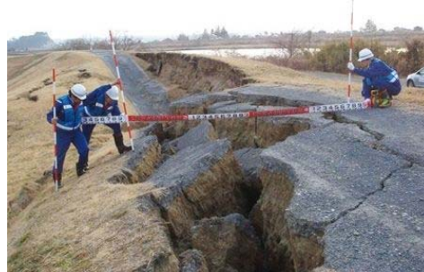
東日本大震災による被災状況

そのため、現状で堤防の無い箇所や堤防の高さが不足している箇所については、順次築堤や堤防嵩上げを実施していくとともに、必要に応じ堤防の沈下を抑制するための対策工事を実施します。