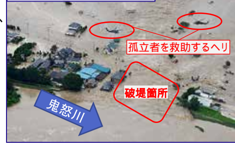
平成27年9月 関東・東北豪雨

「逃げ遅れゼロ」、「社会経済被害の最小化」を実現し、同様の被害を二度と繰り返さない抜本的な対策が急務。