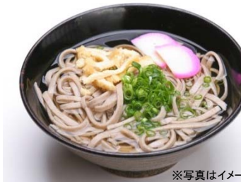
※写真はイメージです 祖谷そば

道の駅「にしいや」は、日本三大秘境、祖谷溪谷の中央部に設けられた道の駅で、名物「祖谷そば」の立ち食いや、地域の特産品の販売などを行っています。