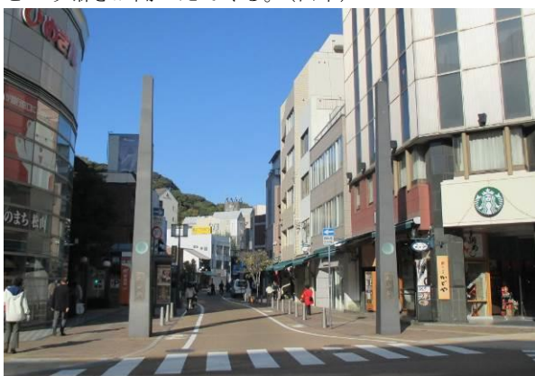
国道 11 号からロープウェー街を望む。観光の玄関口。街路整備がなされ、沿道建築物のファサードなどを改築。統一の突出し看板・オーニングを使用している。

「シャッター通りから生還した街」ロープウェー街は、まさにその名に相応しい場である。全国に点在する数多くの死んだ街のなかで、ここは竣工後 10 年余りを経て、見事に生き返っている。かつては、この街もまた薄暗いアーケードと、シャッターが開まったままの店舗が続く商店街であった。しかし今、松山市民の誰もが「美しい、きれいになった」と称賛する。その、デザイン手法自体は、他の街でも「計画」されているガイドラインと大きな差異はない。「既存アーケードの撤去・店舗ファサードの素材と色彩の共通化・店舗看板のサイズの統一・突出し看板の共通デザイン化・統一オーニングの採用・オリジナルデザインの街路照明やストリートファニチュアの設置・その他多様な運営基準の設定など」そのどれを取っても特別なものではない。しかし、「徹底した実施」がなされていることが、決定的な違いだ。その背景には、この街を運営する人々の並々ならぬ熱意がある。その結果、ごく一部の例外を除き、見事な統一がなされた。そして、空き店舗ゼロという、街の活力を再生したのだ。夜ともなれば、この道を行き交う恋人たちの「とっても素敵な街ね、、、」という囁きが聞こえてくる。(田中)