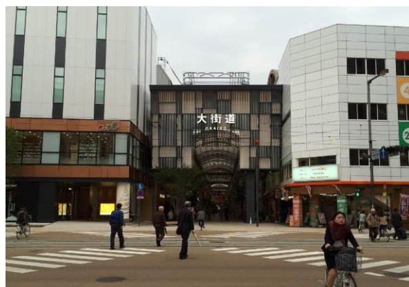
国道 11 号から大街道を望む。商業の玄関口。街路整備がなされ、民間再開発ビルの整備やアーケードのリニューアル整備を実施。