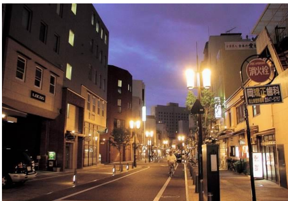
松山城へのエントランスとなるロープウェー街(夜景)。道路整備には、煉瓦・石・鉄など歴史的質感のある素材を使用。