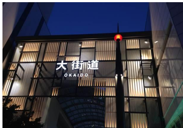
ファサードをリニューアルした大街道商店街アーケード(夜景)。鉄と木目を組み合わせた透過性のあるデザイン。