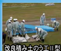
改良積み土のう工II型