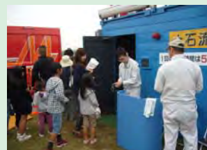
土石流 3D シアター体験