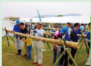
ロープワーク体験