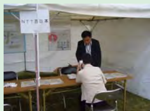
NTT 災害伝言ダイヤル体験