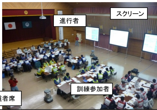
高知県梼原町(平成26年度)における河道閉塞対応訓練の様子