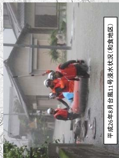
平成26年8月台風11号洪水状況(和食地区)

「この地図は、測量法第29条に基づく複製承認を得て、国土地理院発行の2万5千分の1地形図、5万分の1地形図を複製したものである。」