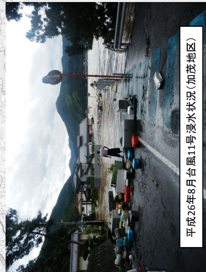
平成26年8月台風11号洪水状況(加茂地区)