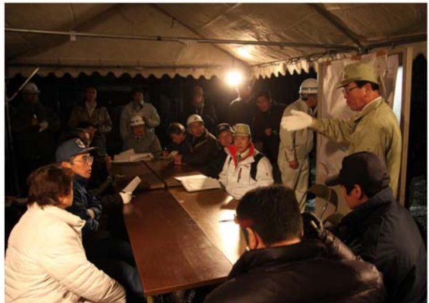
市役所駐車場に設置されたテントでの第1回災害対策本部会議