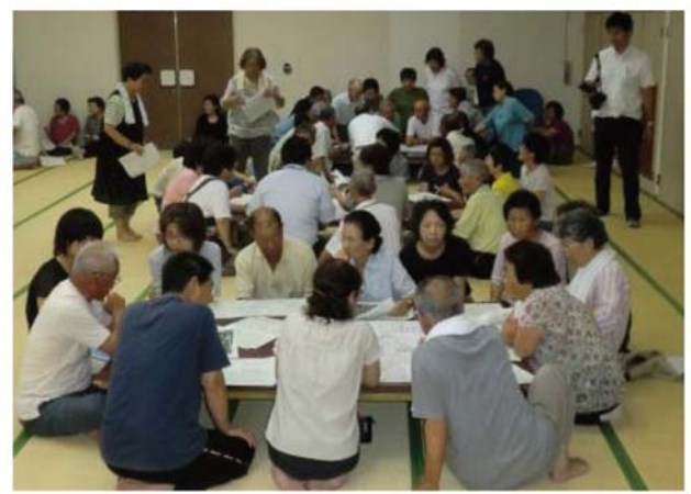
地域担当職員と住民によるワークショップ