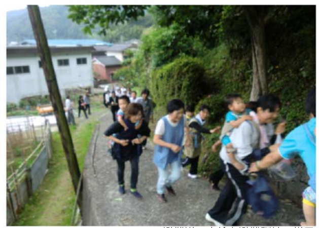
避難道の点検と避難訓練の様子