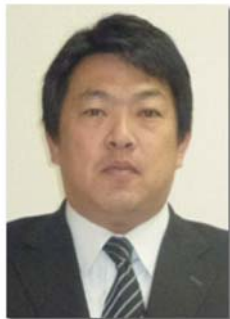
高知県黒潮町 町長 おおにし かつや 大西 勝也