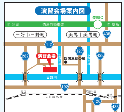
演習会場には、無料駐車場(約280台)がございます。

主催 平成25年度吉野川水防演習実行委員会(国土交通省四国地方整備局、徳島県、美馬市、三好市、つるぎ町、東みよし町)