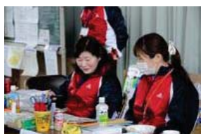
青森市保健所の皆さん

現在、市には多くの他県・他市町村の職員の皆さん、各種団体の皆さんが援助に来てくれています。避難所の支援、り災証明の発行、窓口事務、医療援助など、さまざまな分野でお手伝いをいただいています。皆さんのご協力に感謝しますとともに、今後とも協力して市民の皆さんのために頑張ってまいります。