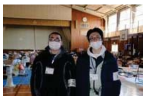
秋田 由利本荘市から