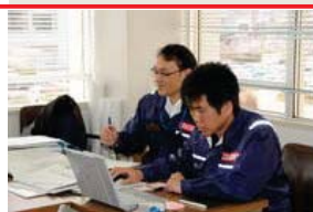
国土交通省の皆さん