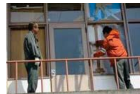
石狩市民図書館から