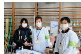
皆さんの健康を守ってます