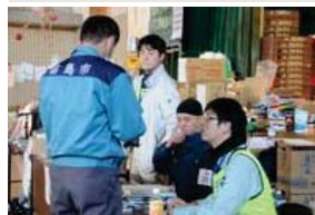
大分県からも来ています