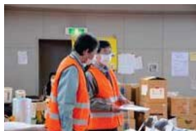
秋田県からの応援