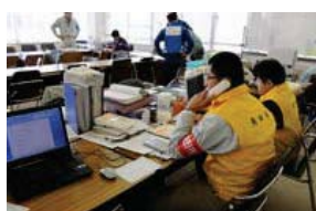
角田市さんは災害対策本部へ