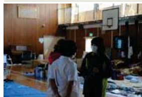
ボランティアの看護師さん