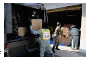
自治労の支援 兵庫県から