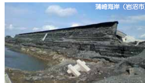
海岸堤防の津波による裏法面の洗掘状況