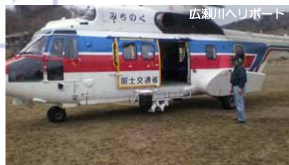
東北地整所有のヘリコプター「みちのく号」に乗り上空から海岸堤防等の被害調査を実施