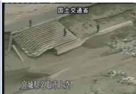
宮城県名取市の海岸堤防の被災状況