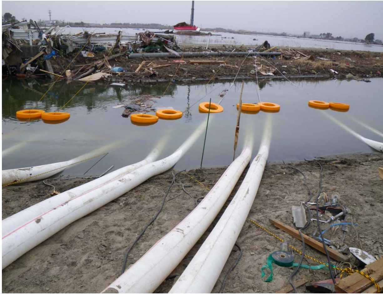
災害対策用稼働写真 3月20日 派遣箇所 ① 排水ポンプ車(21-4894 21-4882)