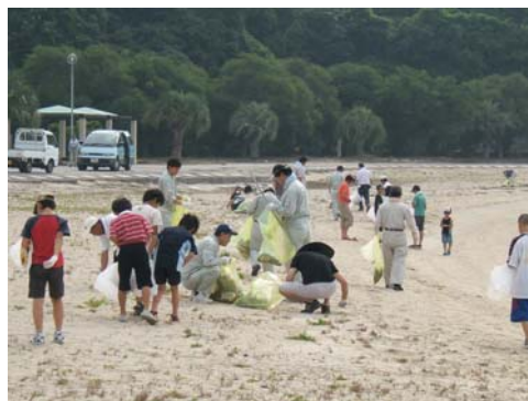
写真 平成21年度『瀬戸内 川と海のクリーンアップ大作戦』