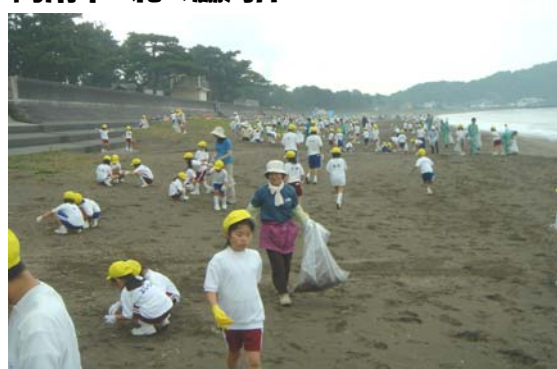
写真 平成21年度『瀬戸内 川と海のクリーンアップ大作戦』の実施風景