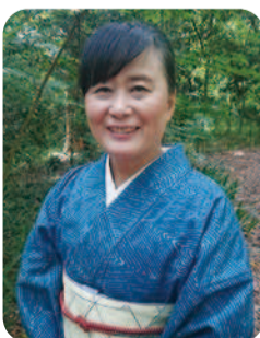
俳人 夏井いつき(愛南町出身)