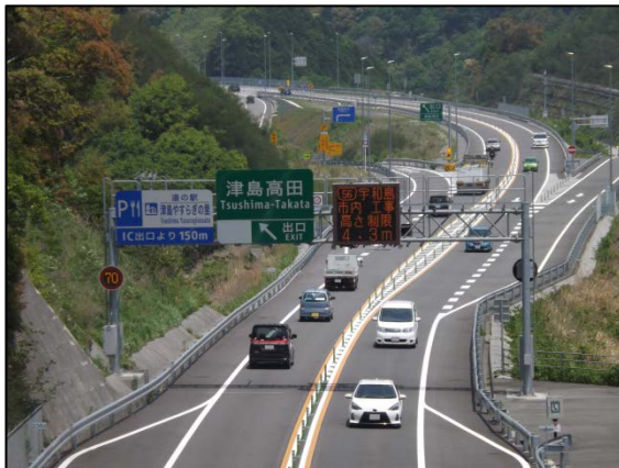
GW中の津島高田IC付近(松山方面を望む)の状況

(H29年度 GW期間中の交通量) H29. 4. 28(金)～H29. 5. 7(日)・・・(10日間) の平均日交通量 (H30年度 GW期間中の交通量) H30. 4. 28(土)～H30. 5. 6(日)・・・(9日間) の平均日交通量