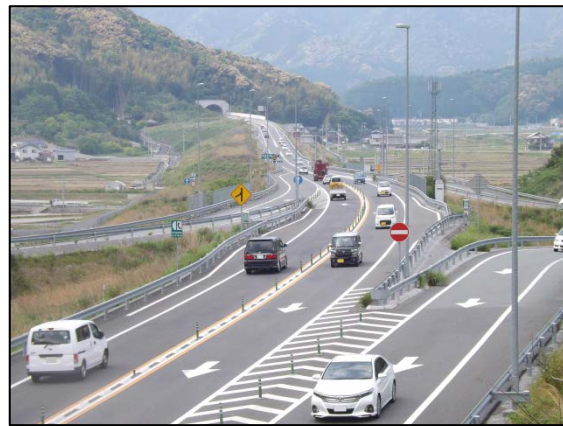
GW中の三間IC周辺(松山方面を望む)の状況