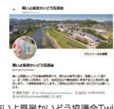
南いよ風景かいどう協議会Twitterアカウント@minamiyofuukei