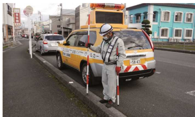
道路パトロール状況