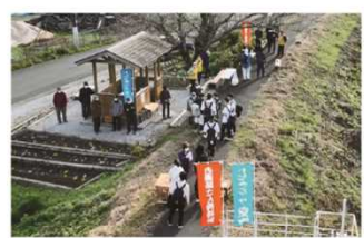
トレッキングザ空海あいなん(R4.12.10撮影)