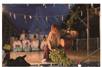
鬼の里の夜神楽 (R1.9.28撮影)