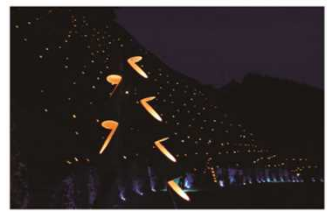
遊子段畑夕涼み会 (R1.8.10撮影)