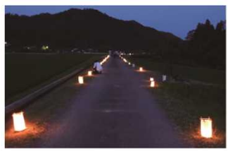
蛍の畦道ライトアップ (R4.6.4撮影)

南いよ風景かいどうHP <URL http://www.skr.mlit.go.jp/oozu/michi/huukeikaido.html >