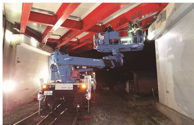
橋梁点検状況（大洲市新谷 新谷跨線橋）