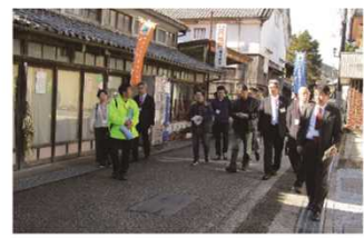
四国風景街道交流会 (R1.11.23撮影)