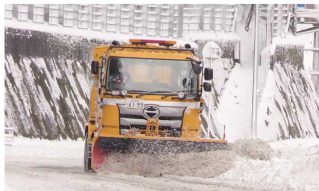
除雪・凍結防止剤散布状況（喜多郡内子町）