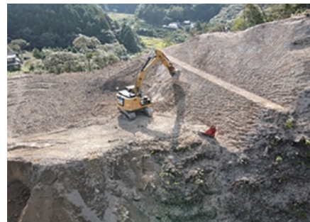
ICTバックボウによる掘削状況