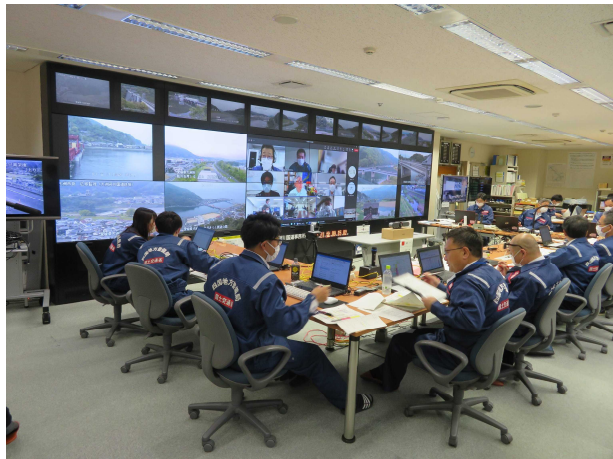
大洲河川国道事務所