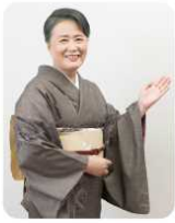
俳人 夏井いつき(愛南町出身)