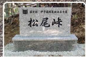
平成30年10月15日に伊予遍路道観自在寺道(松尾峠)が国の史跡に指定されました。