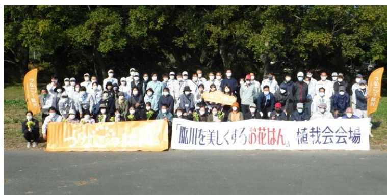
昨年参加いただいたメンバー (令和5年11月10日)