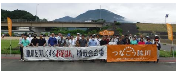
【今年の第1回植栽会の集合写真】