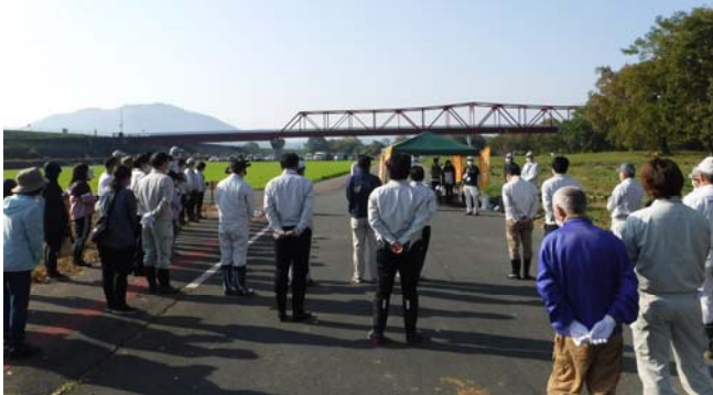
菜の花植栽会状況（令和4年11月10日）