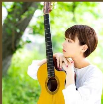
ぼうしさき(大洲市出身)