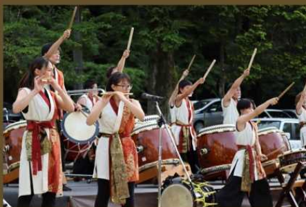
松野鬼城太鼓・ジュニアチーム森風