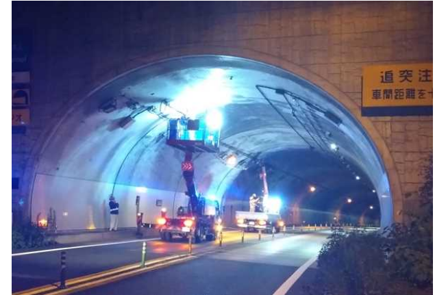
トンネル照明LED化等