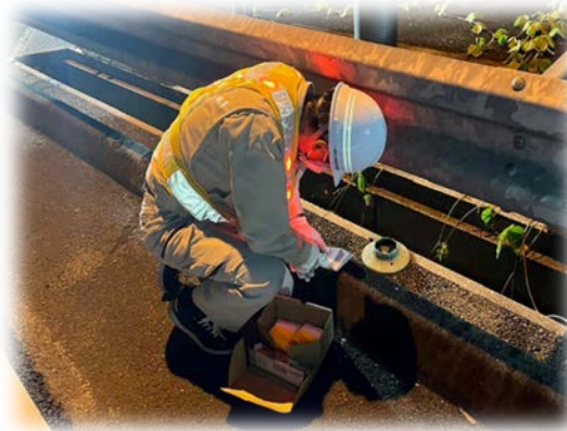
道路附属物の設置・復旧