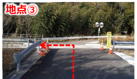
全面通行止め中の国道56号を左折して見学会会場へ