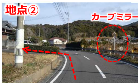
カーブミラーを目印に左折