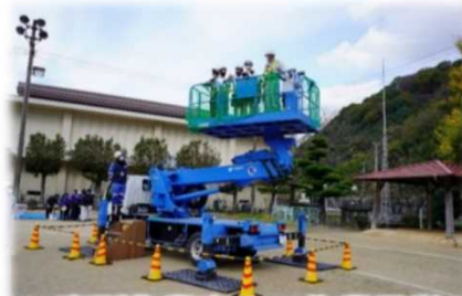
高所作業車での作業見学