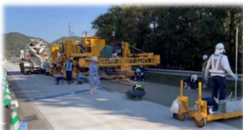
特殊機械の施工状況 （スリップフォームマシン）