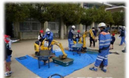
ミニバックホウ操作体験