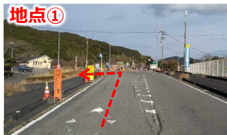
国道56号を左折して迂回路へ