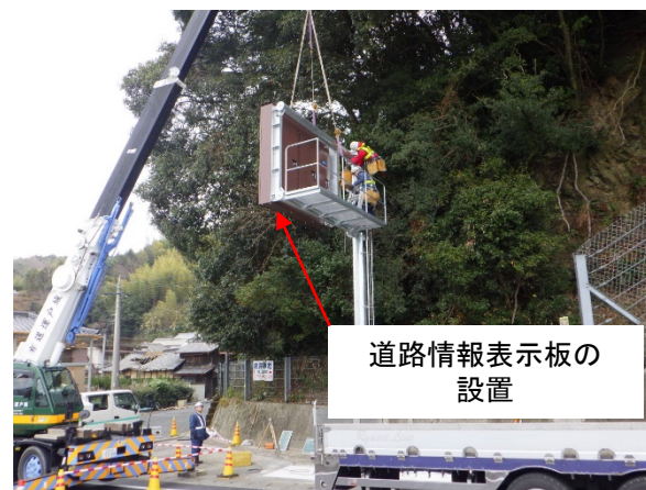
④道路情報表示板設置