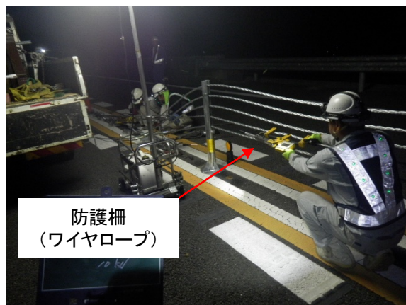
①防護柵(ワイヤロープ)設置

皆様には大変ご不便・ご迷惑をお掛けしますが、ご理解・ご協力の程よろしく申し上げます。