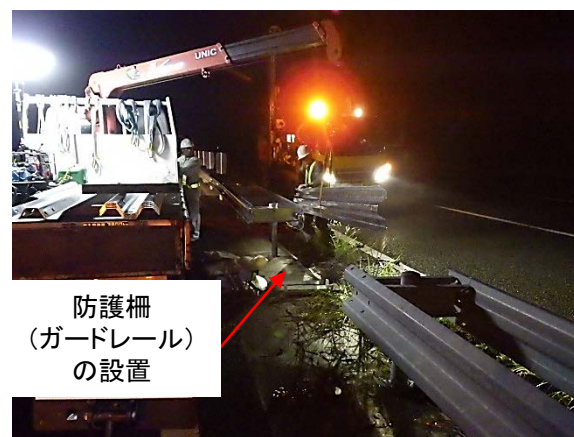
②防護柵(ガードレール)設置