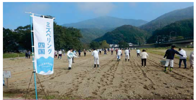
菜の花の種まき状況（平成30年10月25日）