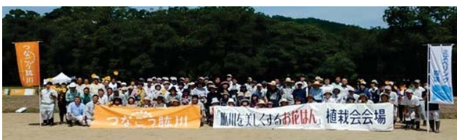
【今年の第1回植栽会の集合写真】