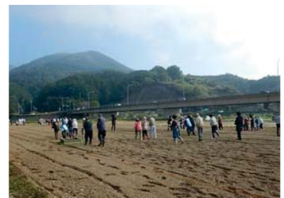
昨年の種まき状況 (平成30年10月25日)

本施策は、四国圏広域地方計画の広域プロジェクト【NO. 3 美しい自然とおもてなしの心による「視国」観光活性化プロジェクト】の取り組みに関連します。