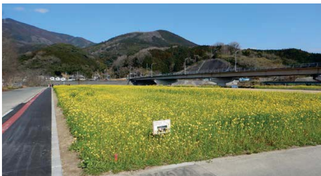
菜の花畑 散策状況（平成31年2月下旬）