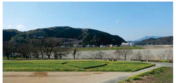
菜の花の満開状況（平成31年2月下旬）