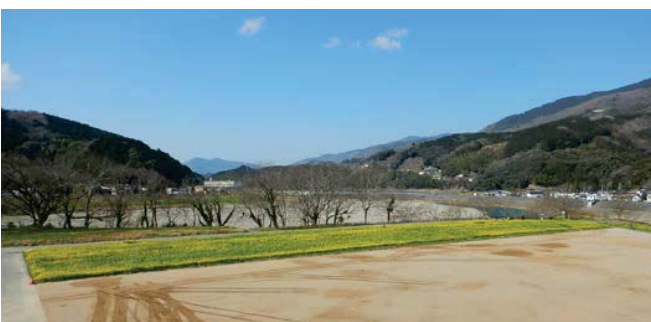
菜の花の満開状況（平成31年2月下旬）