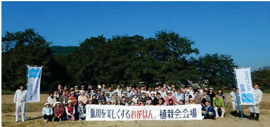
植栽会の集合写真（平成30年10月25日）