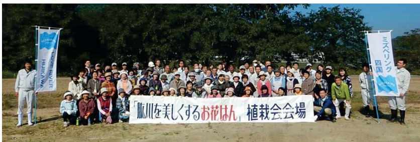
昨年参加いただいたメンバー (平成30年10月25日)