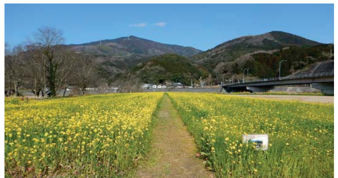
菜の花の満開状況（平成31年2月下旬）