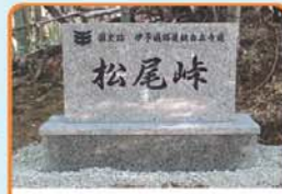
平成30年10月15日に伊予灘路道親自在寺道(松尾峰)が国の史跡に指定されました。

松尾越えコース 10km 一本松風の道コース 12km 杵毛・愛南の道コース 22km