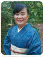
俳人 夏井いつき (愛南町出身)