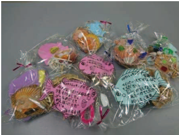
制作した安全祈願お守り