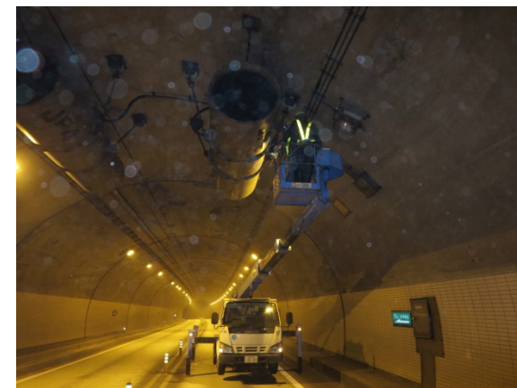
⑥トンネル設備点検