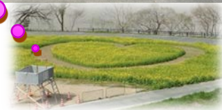
菜の花の開花状況 (H30. 3. 12)