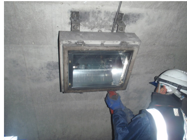
トンネル照明修繕②