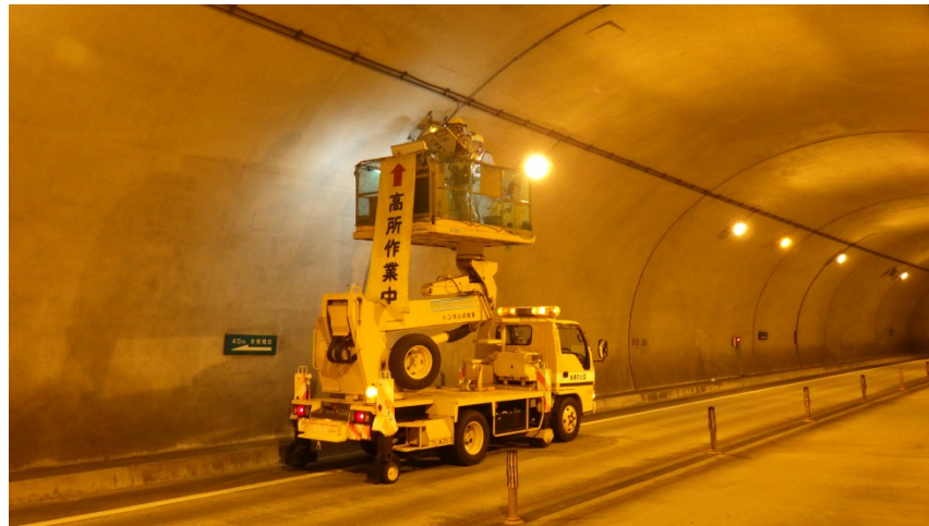
トンネル照明修繕①

宇和島道路(宇和島南IC～津島岩松IC)において、夜間全面通行止めを行い修繕工事を行います。 この工事では、トンネル照明の修繕作業などを実施する予定です。 皆様には大変ご不便・ご迷惑をお掛けしますが、ご理解・ご協力の程よろしく申し上げます。