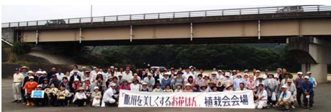
【今年の第1回植栽会の集合写真】