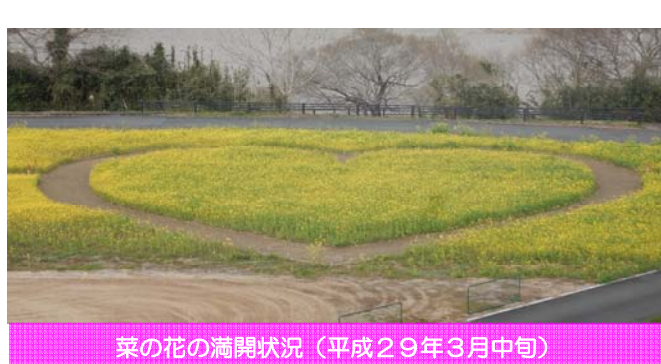
菜の花の満開状況（平成29年3月中旬）