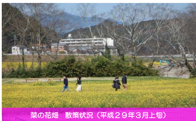
菜の花畑 散策状況（平成29年3月上旬）