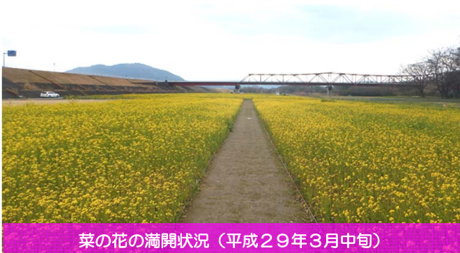
菜の花の満開状況（平成29年3月中旬）