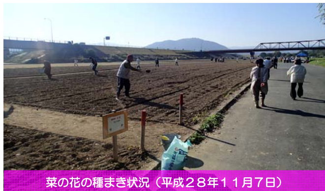
菜の花の種まき状況（平成28年11月7日）