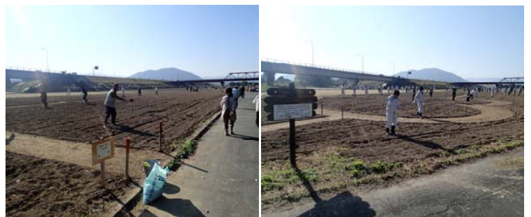
昨年の種まき状況 (平成28年11月7日)