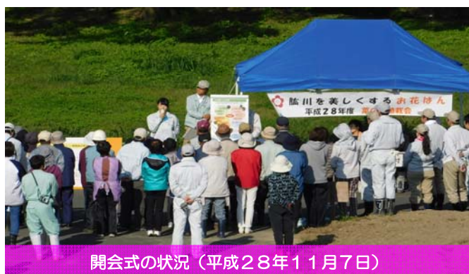
開会式の状況（平成28年11月7日）