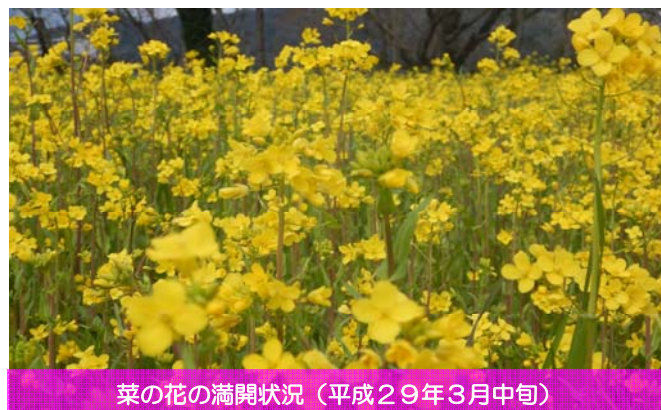
菜の花の満開状況（平成29年3月中旬）