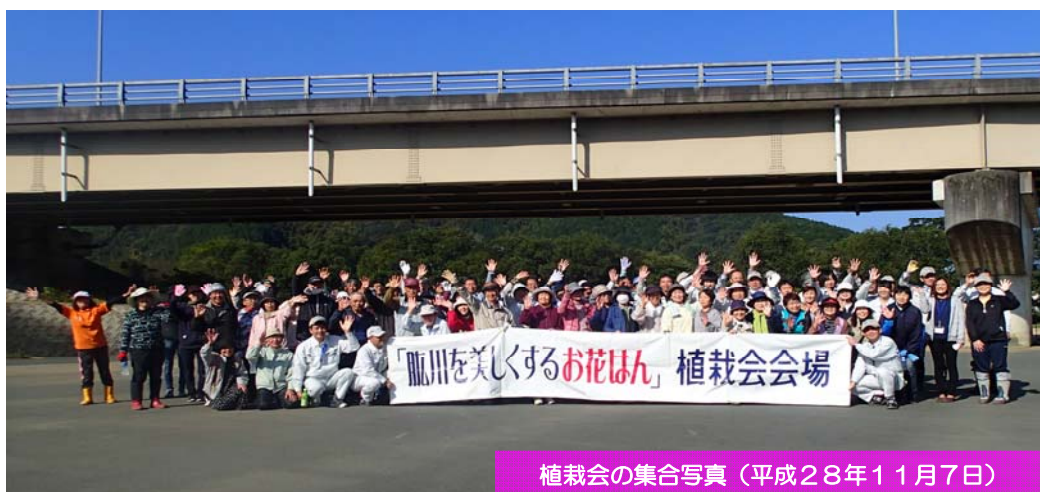
植栽会の集合写真（平成28年11月7日）