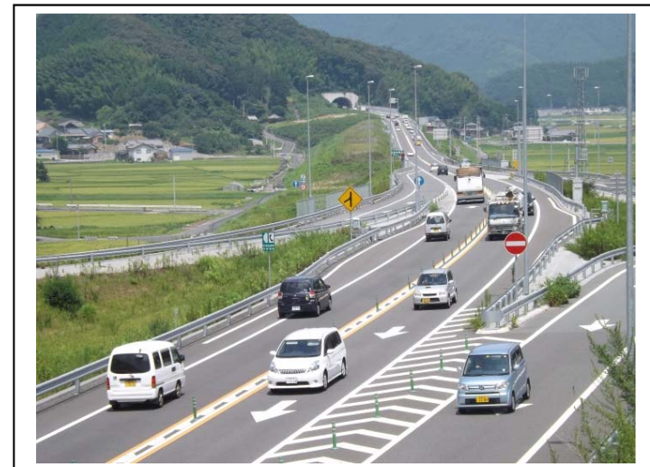
お盆期間中の三間IC(松山方面)の状況