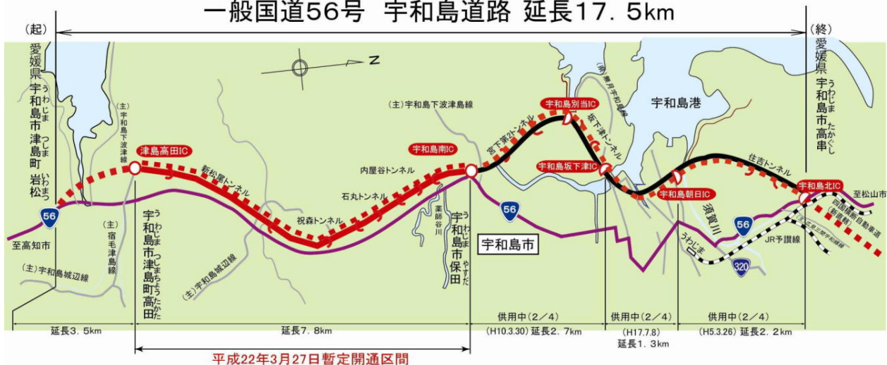
一般国道56号 宇和島道路 延長17.5km