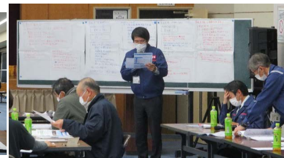
グループワークの結果