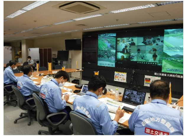
【策定部会開催状況】

肱川流域（水防災）緊急対応タイムラインの第4回策定部会を令和2年7月2日にWEB会議にて開催し、締結したタイムラインについて今後の運用やスケジュールを周知しました。また、気象や河川・ダムの情報などの一元化を図るため「情報共有システム」の運用を開始しましたので、運用方法や機能など説明し、情報共有を図ることを確認しました。