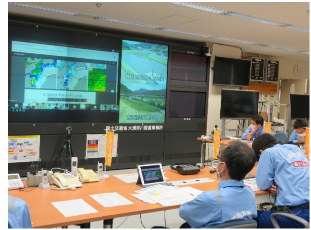
【策定部会開催状況】