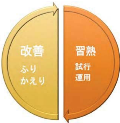
【運用から改善のサイクル】