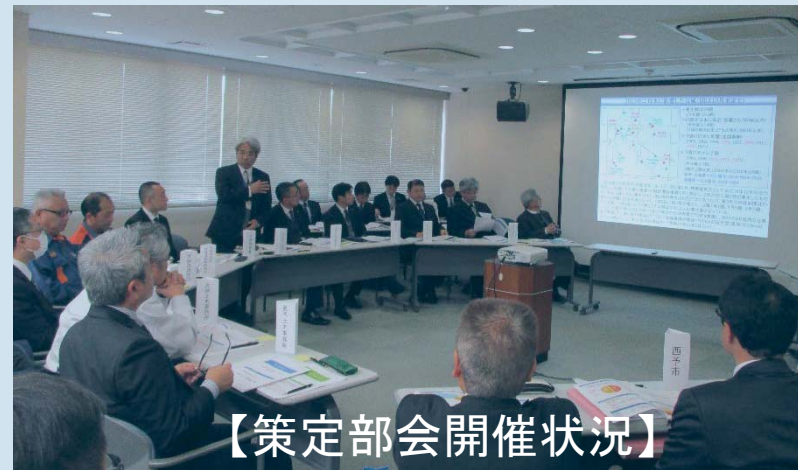
【策定部会開催状況】

日時: 令和2年1月31日(金) 14:00~17:00 場所: 大洲河川国道事務所 2階会議室