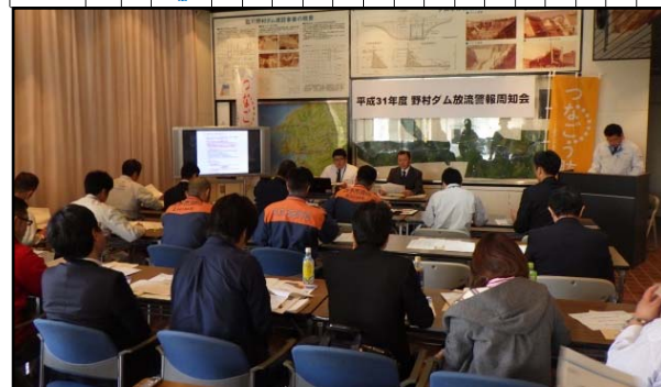
22名の参加により実施された野村ダム放流警報周知会【H31.4.17】