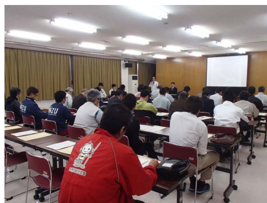
35名の参加により実施された鹿野川ダム放流警報周知会【H30.4.17】