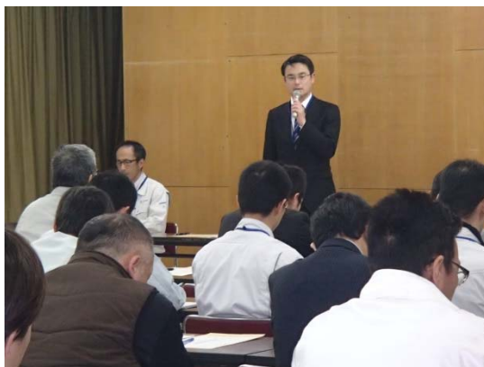
小長井事務所長より適切に情報発信を実施したいとあいさつ