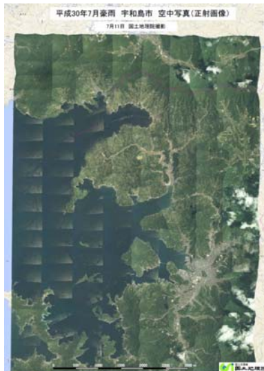
宇和島地区正射写真図