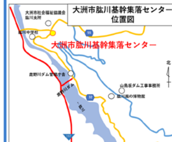
住所：愛媛県大洲市肱川町山鳥坂32

※新型コロナウイルス感染拡大状況により、住民説明会等の運営方法に変更が生じる場合があります。直前に大洲河川国道事務所ウェブサイトをご確認下さい。