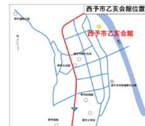
住所：愛媛県西予市野村町野村12-10