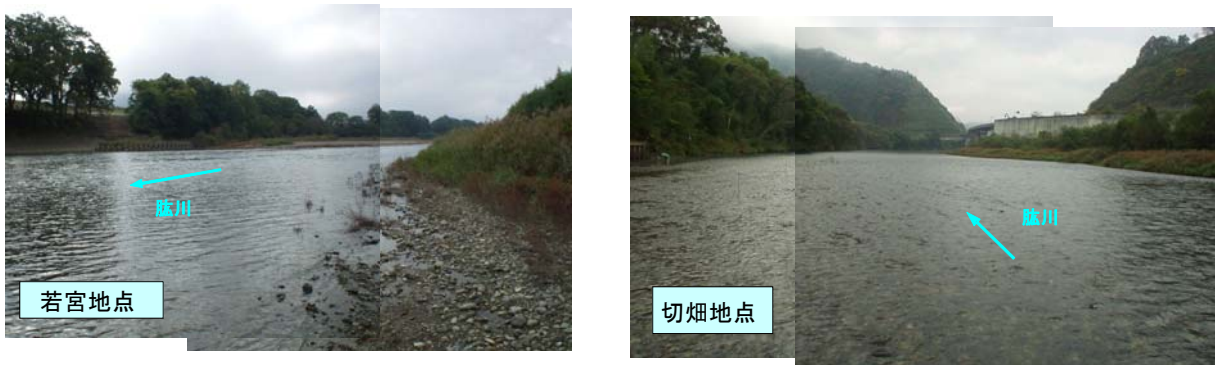
写真 3.5.1 アユの産卵場