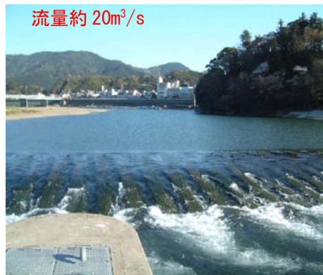
写真 3.1.2 平水流量確保時の状況（大洲床止）

山鳥坂ダムに河川環境容量を設け、鹿野川ダムの河川環境容量と合わせ、渇水時に補給することにより流水の正常な機能の維持のために必要な流量（正常流量）を確保する。また、大洲地点の流量が平水流量程度以下の場合、上流3ダム全体では貯留しないこととし、自然な流れを回復する。