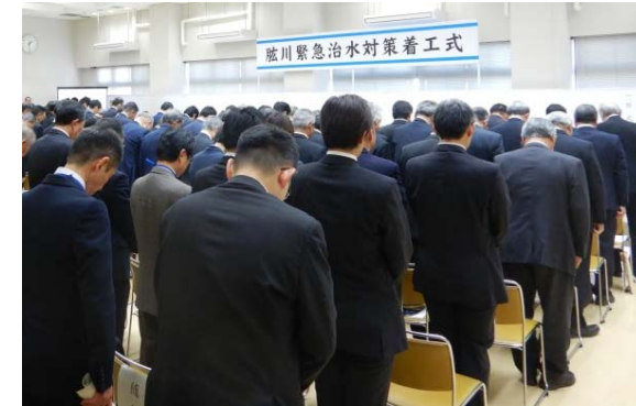
▲式に先立ち行った黙祷