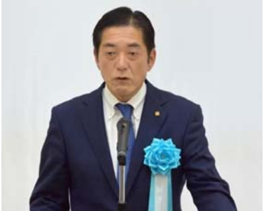
▲挨拶の中村愛媛県知事