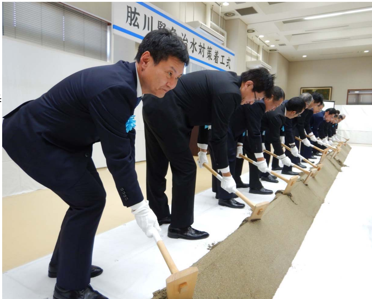
▲工事の安全を願い、「はつくわ」を行う出席者一同